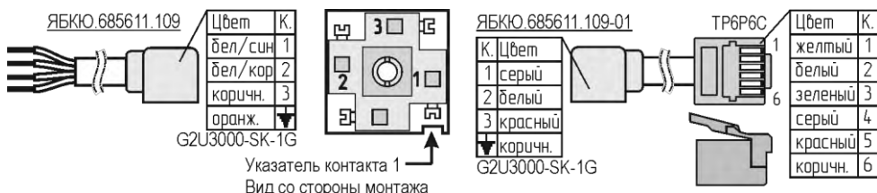
Рисунок 3 – Схема кабелей ЯБКЮ.685611.109 и ЯБКЮ.685611.109-01.

Клапан подключается к управляющему устройству кабелем длиной не более 20 м (входит в комплект поставки).